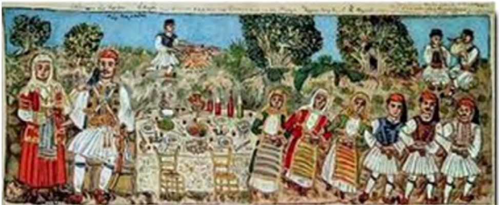
«Ο χορός των Μεγάρων (Τράτα)», 1933