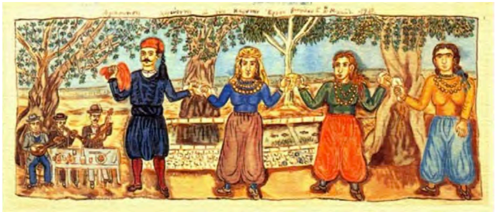
«Χορευτές της Αγιάσσου στην Καρίνη», 1930